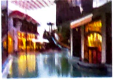
KMC Residency Resort