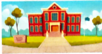
Brilliant Children's Academy